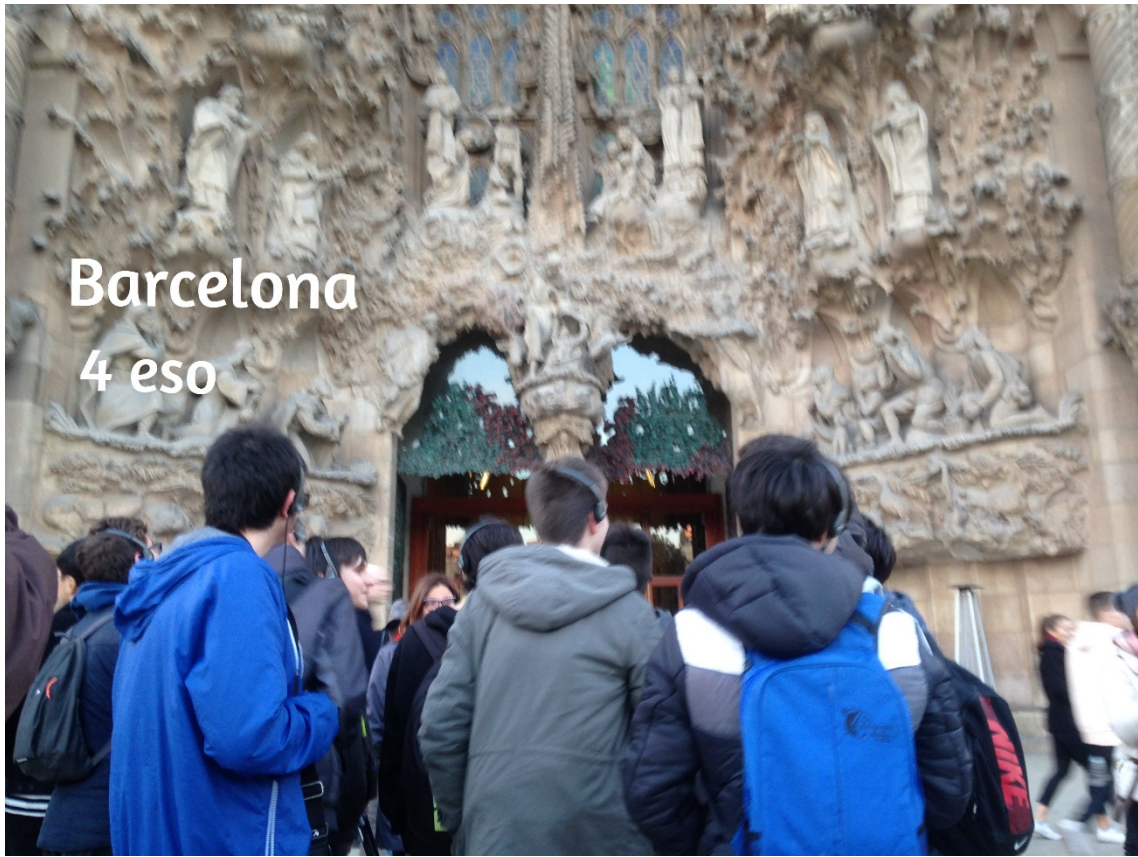
Barcelona 4 eso