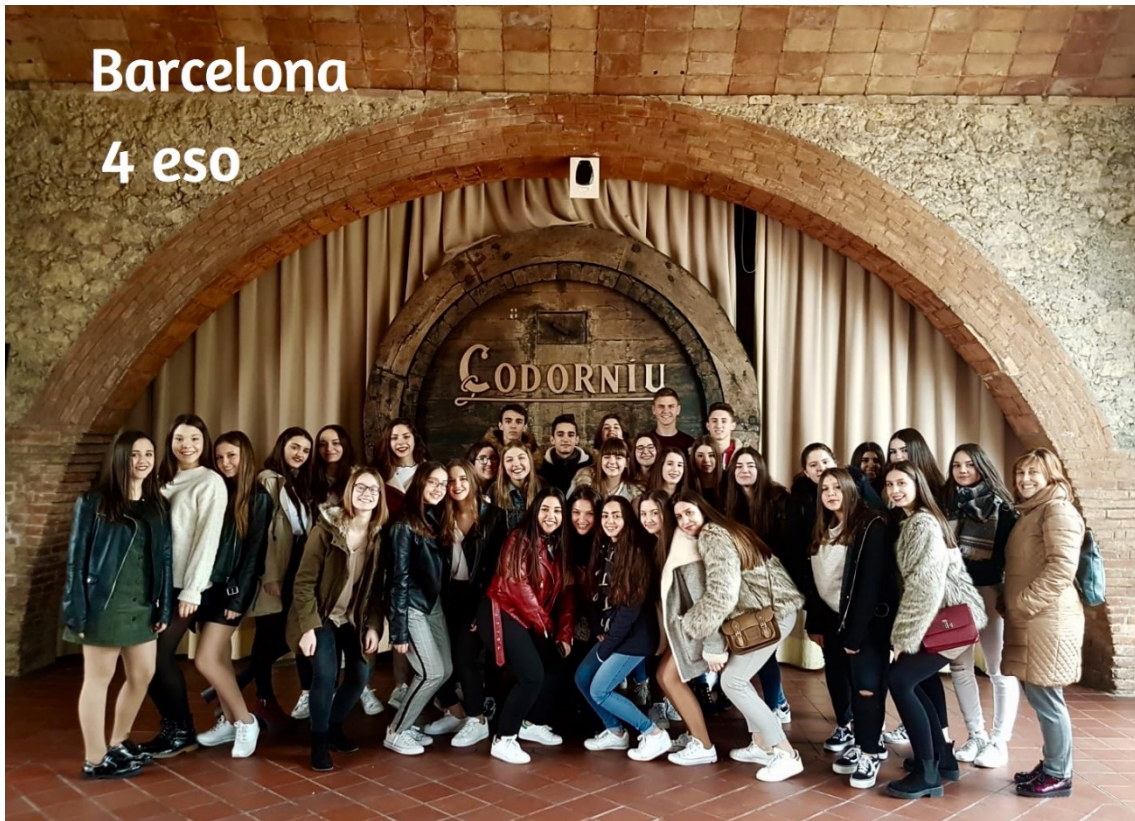
Barcelona 4 eso