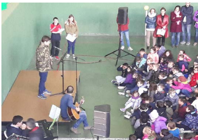
Celebración del Día Internacional de la Poesía

En el primer trimestre, tuneábamos los poemas (con los compañeros de segundo de PMAR). En el segundo trimestre, dábamos la opinión sobre los poemas. Y en el tercer trimestre, hemos leído los poemas en voz alta.