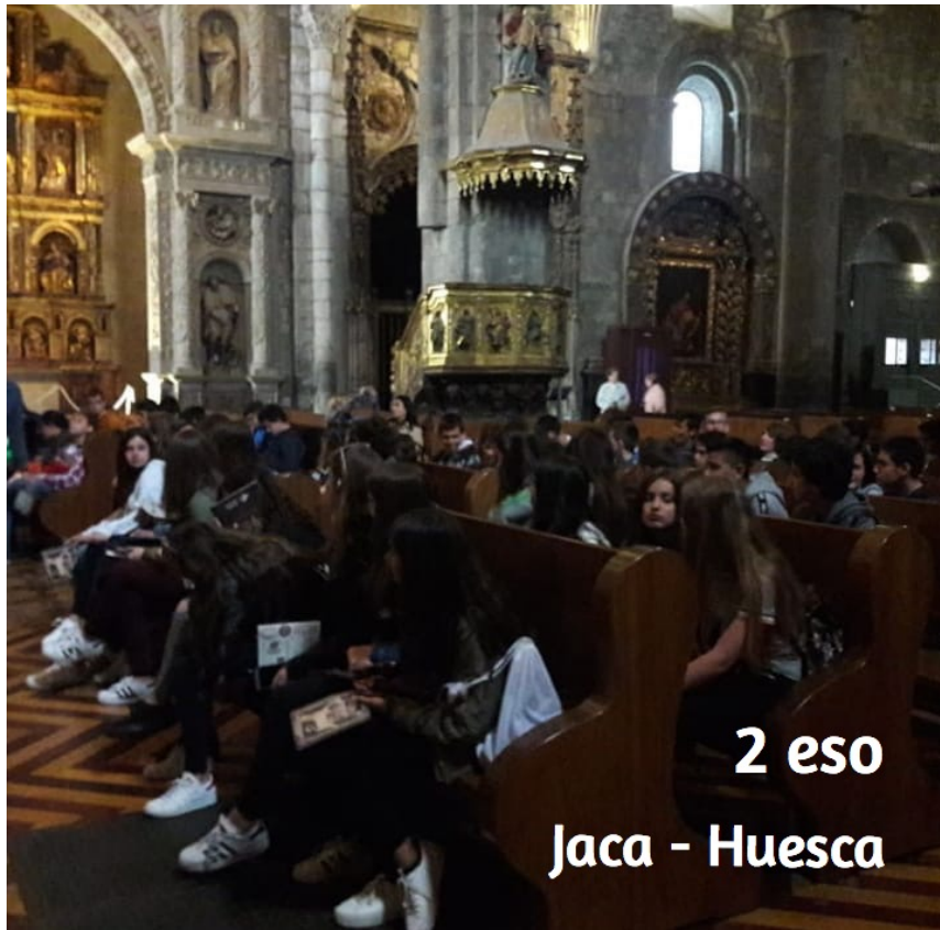
2 eso Jaca - Huesca