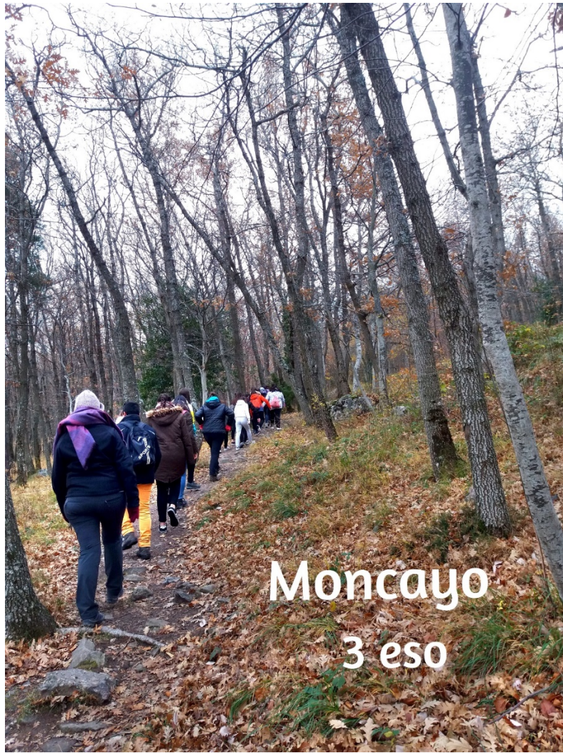
Moncayo 3 eso