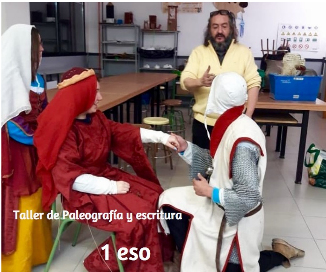
Taller de Paleografía y escritura